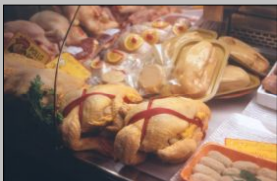
Las carnes, especialmente las que ostentan sellos de garantía -IGP u otros- no han quedado al margen del comercio entre productor y consumidor y pueden adquirirse también a través de Internet.

Pero, ¡cuidado!, no es tan fácil como pueda pensarse, porque resulta que los grandes núcleos de consumidores están generalmente alejados del medio rural, aunque esa lejanía se mida en unos pocos kilómetros. Y el supermercado o la gran superficie está a la vuelta de la esquina y además ofrecen otros atractivos lúdicos asentados sobre deslumbrantes galerías, mármoles o cómodas butacas. Para que el consumidor vaya a recolectarse sus tomates, sus lechugas, coles o las hortalizas que desee, o quiera ver y adquirir los gallos o los huevos en el propio gallinero, hay que sacarlo de casa, hay que obligarlo a desplazarse y a invertir en tiempo y en combustible.