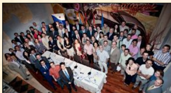
Un aspecto de los asistentes al Seminario sobre el Paquete de Calidad Alimentario

Las eurodiputadas admitieron que hay que buscar equilibrios a la hora de proteger las DOP e IGP y de conseguir que los esquemas de etiquetado sean compatibles con otros. En ese sentido abogaron por una mayor educación del consumidor para dar valor a estas enseñas.