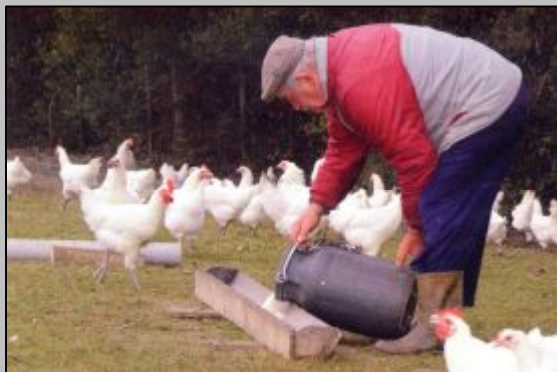
El atractivo de escenas como esta constituyen un poderoso acicate para atraer a los consumidores urbanos al medio rural.