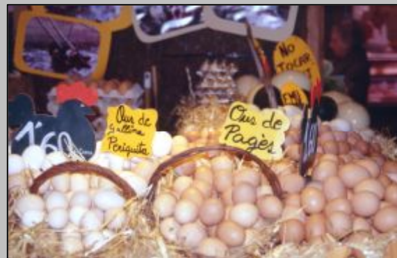
Algunos productos del medio rural llegan a determinados y exclusivos puestos de venta ubicados en algunos mercados de las grandes ciudades.

Por otra, el consumidor puede disfrutar de la frescura del producto, del paso del mismo directamente de las manos del agricultor o del ganadero a las suyas, sin más manoseo, ni traslados, ni perturbaciones ambientales, ni lesiones físicas que las que puedan ocurrir en el paso de unas a otras manos. Eso le permite, al propio tiempo, hacerse cargo del coste económico y del esfuerzo físico que supone la obtención de los productos agrarios y también del daño monetario y del daño moral que la especulación de algunos mayoristas, empresas comercializadoras o cadenas agroalimentarias causan con sus políticas de "precios injustos" al sector primario, bajo el principio de mantener el "ahorro al consumidor", a costa de la estrangulación del beneficio, si lo hay, del productor.