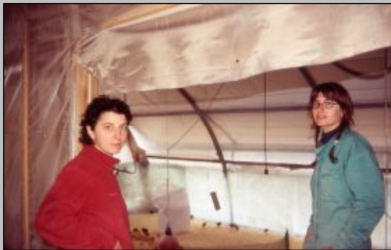
Las dos Nürías, ingenieras agrícolas, creen firmemente en el comercio de proximidad y practican con éxito la "avicultura de vecindad", produciendo pollos ecológicos bajo la marca "La Kresta", en la comarca barcelonesa de El Maresme.

Y una de las consecuencias de esa, al parecer, creciente, "preferencia por la proximidad" lo tenemos en el lento pero activo e insistente movimiento a favor de la venta directa de productos agrarios al consumidor o, a la inversa, la compra directa al productor, que está tomando auge en muchas regiones europeas, incluidas las españolas. Y, a simple vista, eso es de celebrar por varias razones.